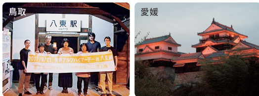
（写真は昨年度の様子）