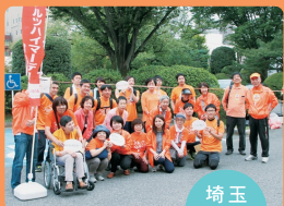
埼玉県庁を囲む大きなオレンジリングを作ろう