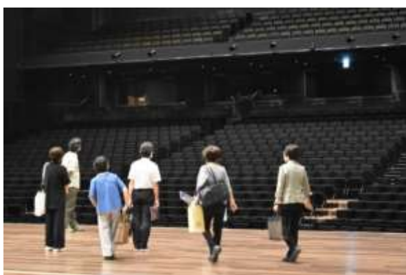
会場の広さに圧倒されました