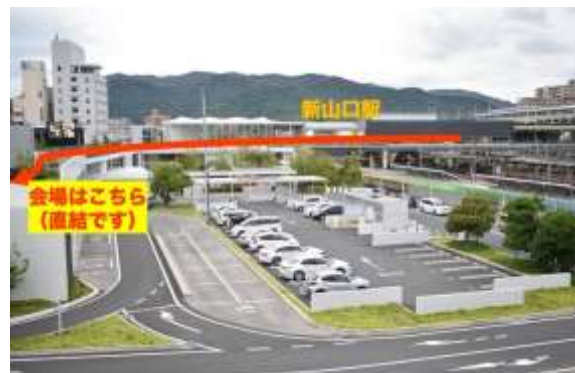
会場までは駅から直結です