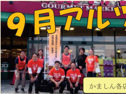
かましん各店入口でリーフレット配り