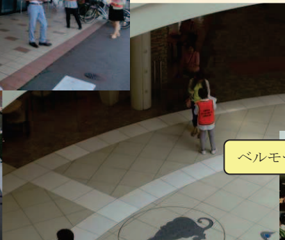
ベルモール店内でリーフレット配り