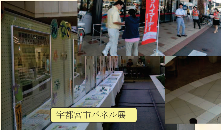
宇都宮市パネル展