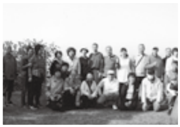
宮崎城跡で集合写真