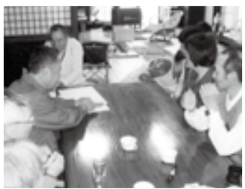
みんなで話し合い