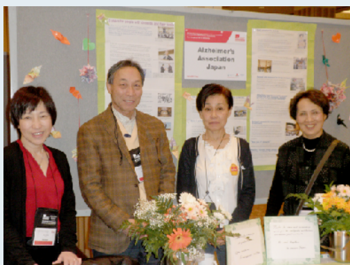
日本のブース前で「家族の会」代表団