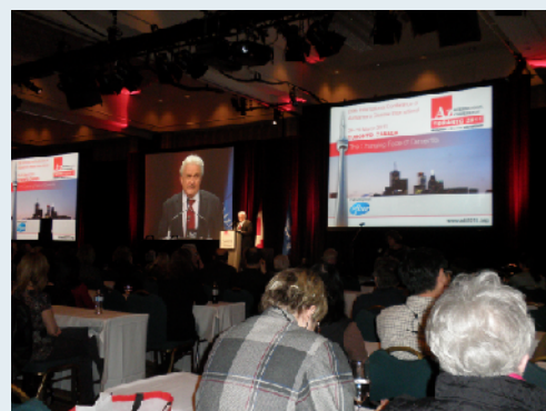
カナダ代表の開会挨拶

*それにつけても、言葉の壁はどうしようもなく、これから努力しても無理な話、残念で悔しいです。自由に話せたり聴いたりできたら、もっともっと有意義な時間を過ごすことができたでしょうに・・・