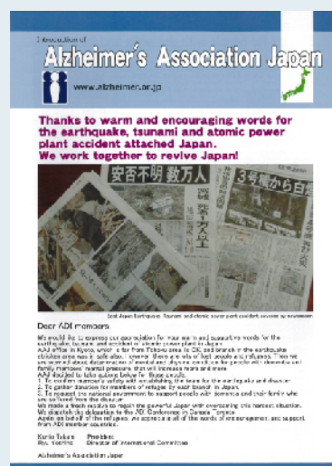
震災の記事を載せた配布パンフ