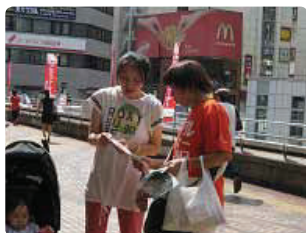
ママは入浴ヘルパーさんですって●埼玉県支部 行政、製薬会社、ゆるキャラ、子どもなども参加して合計71名で配布