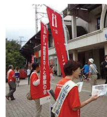
JR元町駅前で27名で配布●兵庫県支部 県職員、製薬会社の職員が初めて参加されました