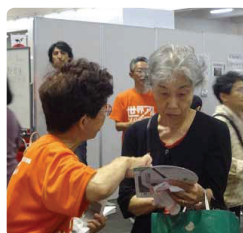
SKYフェスタでは相談ブースも設置●京都府支部 「つどいや相談も受けています」と「家族の会」の説明も