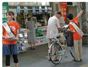
配布中に相談を受けることも●千葉県支部 総勢32名。残暑の千葉駅前で配布。受け取る人も真剣な表情です