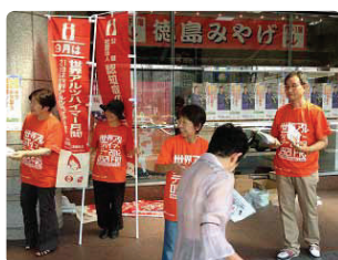
徳島駅前での街頭行動●徳島県支部 製薬会社の方3名を含め、10名で配布しました