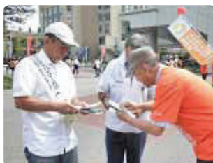
ご本人2人相談しながら、チラシ配り●神奈川県支部 総勢50名の参加者で、桜木町ランドマーク広場にオレンジのTシャツがとても、映えていました