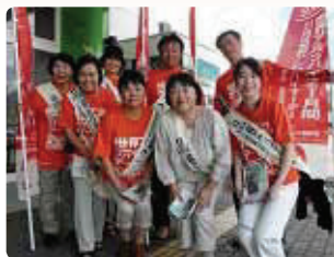
仲間の輪が大きく●福井県支部 半数の人が初参加。みんな肩を寄せ合い笑顔で旧知の友のよう