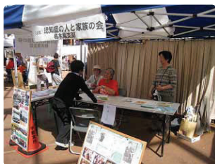
宇都宮市のまちびあ祭りで配布と相談会●栃木県支部 県北、県南でも配布。「介護しました」「自分も物忘れがあります」と話をしてくださる方も