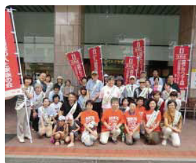
4ヵ所の街頭活動に126人が大集合●大分県支部 リーフレットをその場で見る人が増え、関心の高まりを実感しています