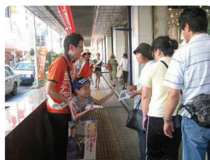
親子で楽しく行動●福島県支部 今年は2組の親子が参加。子どもたちのリーフレット配布力はすごい