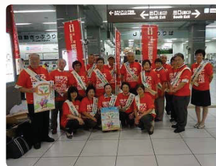
県庁と一緒にリーフレット配り●静岡県支部 県長寿政策局長らとアルツハイマーデーや介護中マークの普及のため配布しました