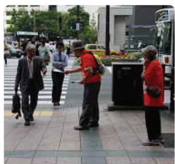
主人と一緒に私も手伝っています●福岡県支部 介護者とご本人、いつも一緒です