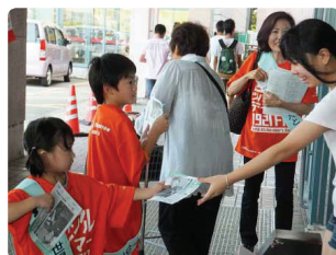
可愛い助っ人さんが大活躍●新潟県支部 終了後、残ったリーフレットをボクが「もらっている?」学校でみんなに配りたいと言うのです