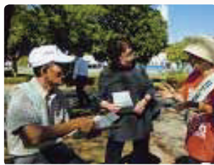
説明に耳を傾ける人々●山梨県支部 スポーツ祭典での相談コーナーに立ち寄る人も増えました