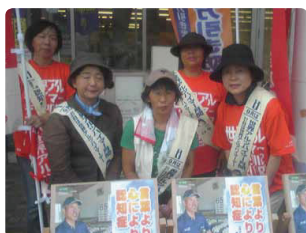
家族・製薬会社と共に認知症理解のアピール活動●山形県支部 奥様を介護中の元大工さんが、ポスター盾ボードを6枚も作ってくれました