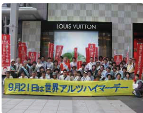
街頭啓発活動は4ヵ所で161名参加●広島県支部 行政（県、市）・社協（県、市）・施設の職員と一緒に汗を流し熱い交流をしました