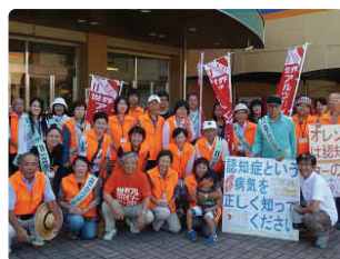
炎天下、必死のキャンペーン！●滋賀県支部 4ヵ所で合計78名が参加。おまけのティッシュが効果絶大でした