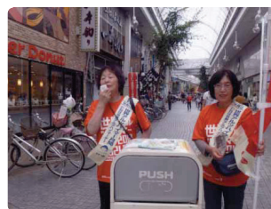
質問や身の上話もあり、うれしい街頭活動●高知県支部 「認知症の人が300万人を超えました」と街を行きかう人に呼びかけました