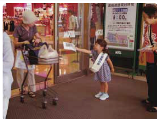
将来の世話人後継者?です ●宮城県支部 仙台の大型スーパーで、会員のお孫さんも元気に配ってくれました