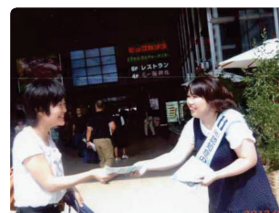
認知症もっと理解して あなたも わたしも●茨城県支部 「ごころうさま」と笑顔でリーフレットを受け取ってくれました