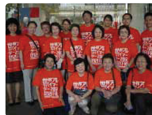
若者のパワーを力にして●東京都支部 猛暑の中、製薬会社サポーターなどの若い力を借り20人余りのパワーで、たくさん配布できました