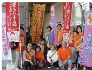
「心はひとつ」5ヵ所で一斉に●山口県支部 下関市では行政、地域家族会などと合同で啓発活動をしました