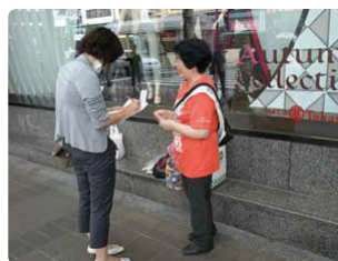
地域の人の理解を深める行動●愛媛県支部 地域新聞社へも街頭行動の意義や「家族の会」の活動について熱弁！