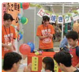
認知症ゲームでちびっ子も大喜び●愛知県支部 アピタ東海荒尾店内にて啓発イベント&リーフレット配布