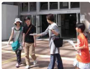
子どもたちがオレンジTシャツでPR●石川県支部 大学の先生、学生さんも参加してくれました