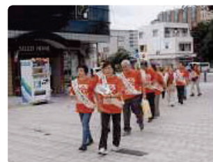
オレンジのTシャツで街頭行進●富山県支部 「どうぞ読んで下さい!」本人2人も参加して配布しました