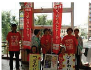
秋田駅前配布●秋田県支部 若年性認知症サポーター「つばみの会」の会員さんも参加