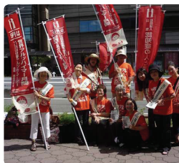
オレンジTシャツでよろし！●奈良県支部 大和西大寺駅前では11名が汗びっしょりで配りました