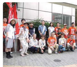
JR天王寺駅で街頭活動●大阪府支部 男性会員さんが家族を連れて参加いただきました