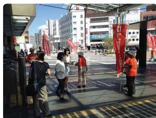
松本駅で一斉活動●長野県支部 今年は松本で街頭活動、暑いか道行く市民に呼びかけを行いました