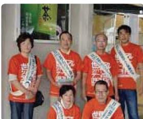
ゆめタウンと佐賀駅バス前で配布●佐賀県支部 ゆめタウンでは、買い物客が多く、ほとんどの方が受け取られました