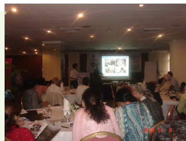
アルツハイマー大学での発表

地域会議では、日本における「家族の会」の活動と2009年世界アルツハイマーデー行動の概要について報告発表しました。また、併せて開催されたADIアルツハイマー大学にも参加し、「家族の会」の支部における相談・つどい・会報の3つの活動について発表しました。