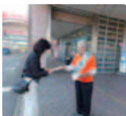
在宅介護中の方も忙しい中足を止めて●新潟県支部 今日はショートなのでと普段できない買い物にきた方が受け取ってくださいました