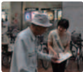
専門職も加わって ●岡山県支部 街頭で認知症の症状などの相談もありました