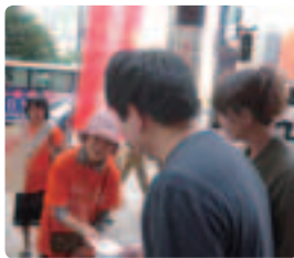
若い人にも大事な問題ですよ ●福岡県支部 「読んでみてください」精一杯の笑顔で渡す