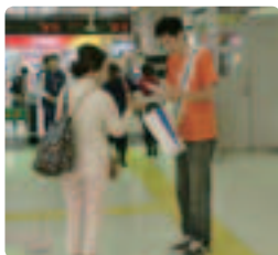
緊張から震える手で渡ししながら一言●埼玉県支部 困っている人を見かけたら一声かけてあげてください