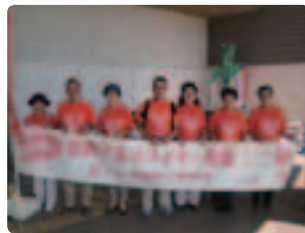
大型施設の入口で2時間配布 ●佐賀県支部 オレンジTシャツや横断幕効果で受け取りも良く、理解が深められていると感じました