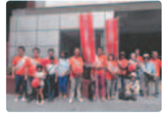
会員のお子さんが大奮闘！ ●大阪府支部 天王寺・池田駅とも、会員の飛入り応援のおまけも反映し、盛り上がりしました