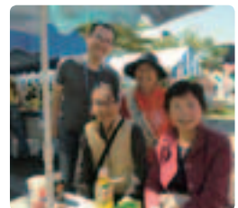
ご本人も参加●山梨県支部 製薬会社の方を含め22名で配布しました