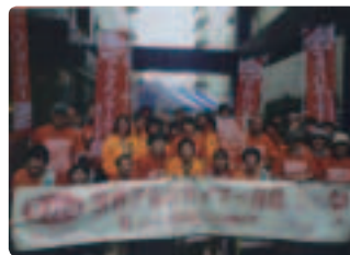
すごい数での街頭行動 写真に入り きれません●福島県支部 県内参加者107名（うち行政、地域包括職員28名）