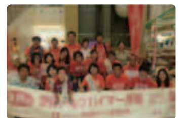
独自作成したうちわを活用して活発な啓発活動 ●沖縄県支部準備会 認知症の本人や看護学生を含む20名が、オレンジTシャツを着て