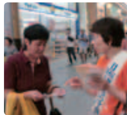
認知症のことを知ってください ●長崎県支部 県内2ヵ所、総勢73名で実施。「私にも手伝わせて！」と、毎年参加者が増えています