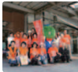
徳島駅前ですだちくんと一緒に ●徳島県支部 県の認知症対策普及・啓発推進月間と兼ね、大規模展開できました