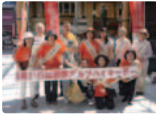
天高く！声あげて！ ●奈良県支部 9/21秋晴れの奈良駅行基菩薩像前で、本人さんも含め15名の参加です