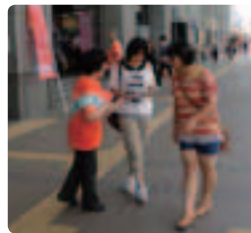
松山市のデパート前で若い女性も立ち止まり ●愛媛県支部 配布中に「自分も心配なんだけど」「母を介護しています」という反応も