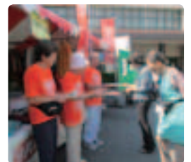
静岡駅と健康まつりの2日間しっかりアピール! ●静岡県支部 エーザイ、ヤンセンファーマ、県職員と総勢30名。受け取る側の関心が深く気合が入りました