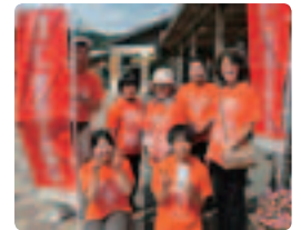
今年も秋晴れの観光地「那須塩原道の駅」で●栃木県支部 20歳の学生から78歳まで幅広い年齢層の参加。「ありがとう」と笑顔で手にとってくださいる声が力をくれました