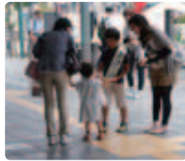
今年も頑張りました ●和歌山県支部 毎年お手伝いしてくれる和歌山のマスコット「そう太くん」