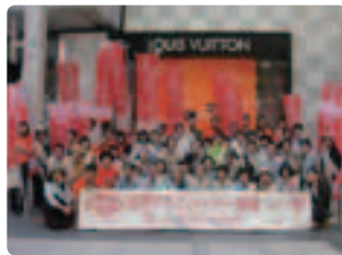
サプライズに、大喜び！ ●広島県支部 配布場所のブランド店が気を利かせて店をオレンジにライトアップしてくれました