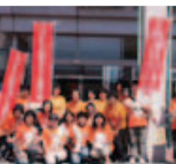
オレンジのユニフォーム着用●福井県支部 鯖江市認知症サポーター7名も応援に駆けつけ、共に街頭行動をショッピングセンターで実施