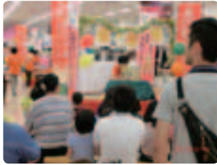
スーパーでの認知症啓発イベント!! ●愛知県支部 子どもから年配者まで1000名を超える来場者で賑わいました