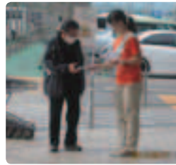
県内5ヵ所で街頭活動 ●青森県支部 製薬会社の方や大学生もオレンジTシャツで配布