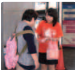
新宿駅西口で街頭活動を展開●東京都支部 製薬会社の若い人も加わり、行き交う人々に認知症問題をPR