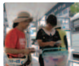
旅行者も真剣に受け止めて… ●鹿児島県支部 横断幕とオレンジ色のTシャツが、私たちにも勇気をくれました