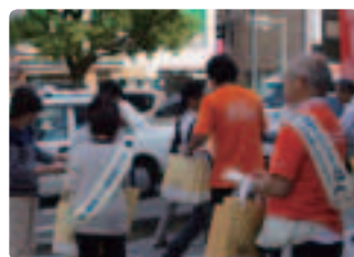
今年も配布者の方が多い？ ●宮崎県支部 約30名の参加者。ちびまる子ちゃんのバッグ大好評!!