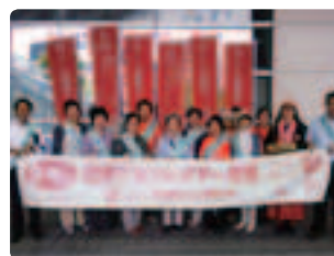
横断幕をもって●岐阜県支部 製薬会社からも参加で2ヵ所30名参加