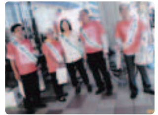
ご本人も夫婦で参加 ●島根県支部 熱心な姿勢に感動。通りすぎりの方も快くリーフレットを受け取ってくれました