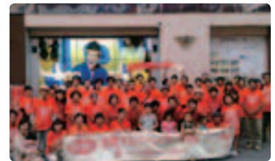
4ヵ所、総勢90名参加 ●熊本県支部 以前より認知症に関する認知度、関心度が高まっているように感じました