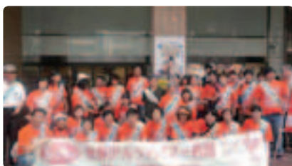
本人5名も参加 ●大分県支部 総勢115名での配布でした