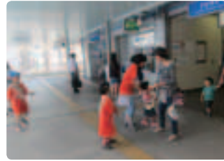
子どもたちもオレンジTシャツで大活躍 ●滋賀県支部 県内4ヵ所で会員を中心にキャラバンメイト、行政、事業所等が力を合わせました