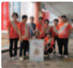
地道に配布●秋田県支部 今年は、ご本人さんとエーザイのMRさんが手伝ってくださいました