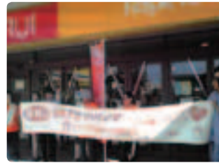
スーパーマーケット前で ●鳥取県支部 今年は横断幕をもってアピール