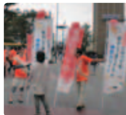
オレンジ軍団集合! ●神奈川県支部 本人、家族、県、横浜市の職員一緒に行動。早くも市民から話しかけられました