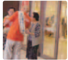
介護相談中●宮城県支部 仙台市の大型スーパーの入口で