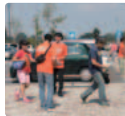
オレンジパワー全開!! ●茨城県支部 若い人の協力が輝いていました。「私にもください」に思わず嬉しくなりました