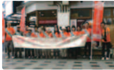
盛岡市での集合写真 ●岩手県支部 多くの方々にお手伝いいただき感謝