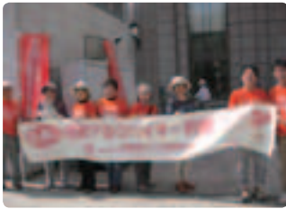
幅広い年齢層に配布 ●北海道支部 15ヵ所で、80名が参加しました