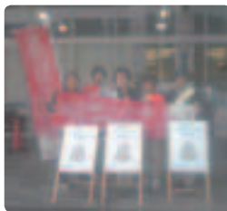
北村山スーパーヤマザワ前 行動●山形県支部 受けとってくれる人の表情に、理解が深まっている手ごたえを感じました