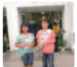
親子連れの参加でうれしかった ●高知県支部 読売新聞の取材も受け、17名の参加者がはりきって配布しました